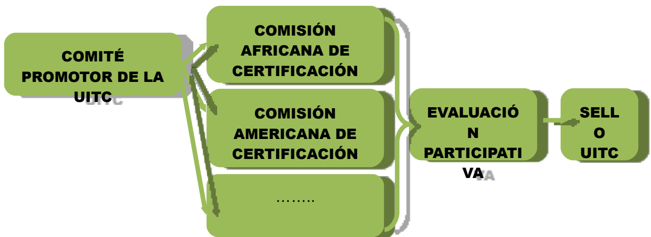
Figure 4.- Comisiones territoriales de certificación.

✓ ¿Cómo se asegura la transparencia y la fiabilidad en el sello de la UiTC?