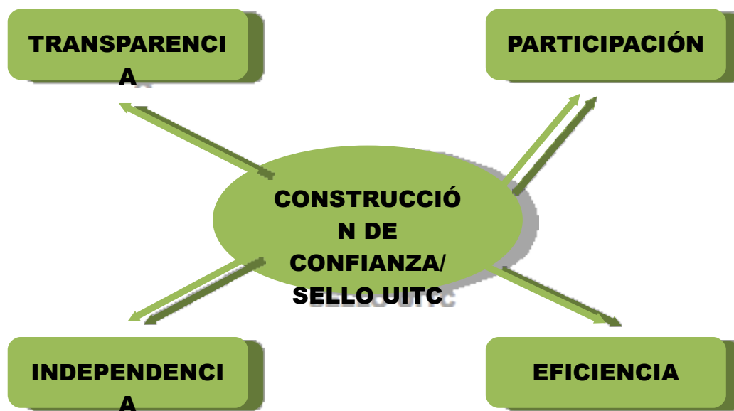
Figura 3.- Bases de la certificación participativa.